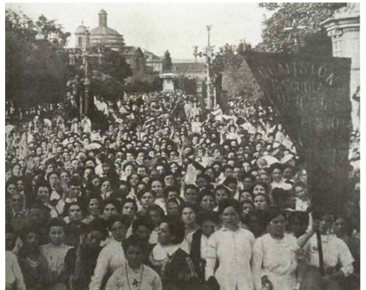
Manifestació de dones de Barcelona, convocades per Ángeles López de Ayala, el 10 de juliol de 1910, a favor de l'educació laica.

I després va arribar la dictadura franquista.